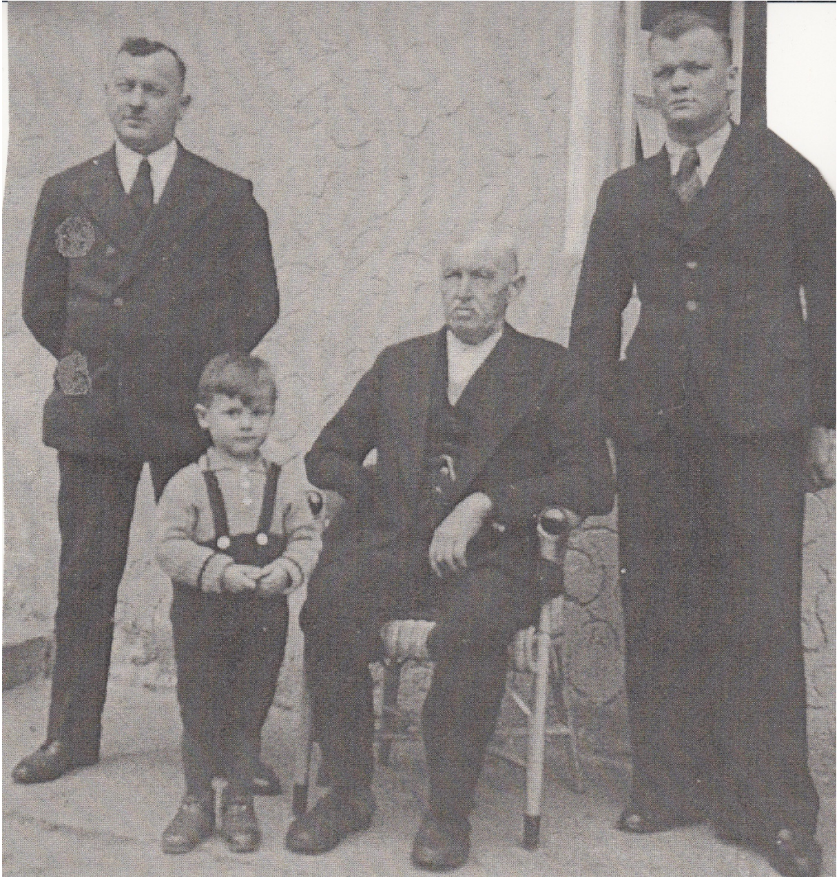
Drei Schmiede-Generationen (Karlstetter)