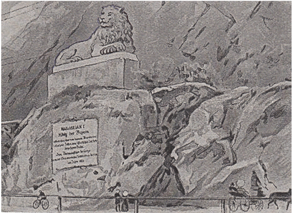
Der Löwe von Schalding