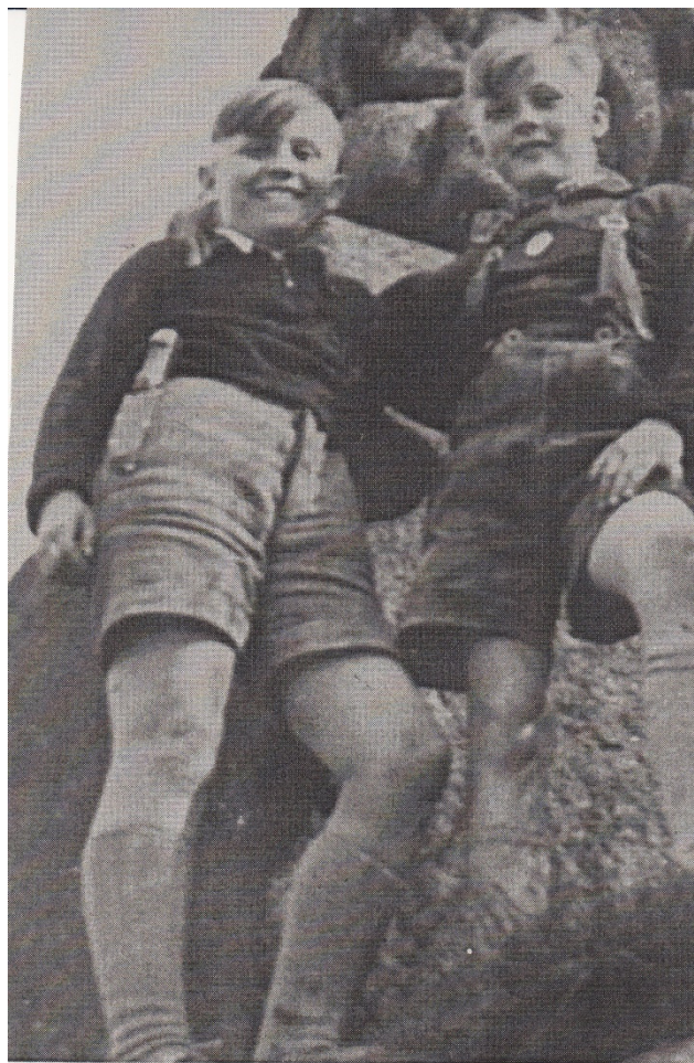
Dorfbuben mit Fahrtenmesse

Angreifern gewittert wurden. Doch auch wenn einer der Gejagten gesichtet war, hieß das noch lange nicht, dass man seiner habhaft wurde. Er konnte auch Rückendeckung seiner Kameraden bekommen, so dass die Festnahme und Ausschaltung praktisch unmöglich war. Jedenfalls lief man, sprang man, versteckte sich und kämpfte man bis buchstäblich zum Umfallen. Neben dem Fußballspiel war das sommerliche Räuber- und Gendarm-Spiel eine atemberaubend schöne und zeitraubend gefährliche Beschäftigung. Für die Bewältigung von Hausaufgaben oder häuslicher Familienunterstützung blieb da natürlich kein Spielraum. Misstrauische Eltern gab es genug. Doch den Buben blieb alles bestens in Erinnerung. Sie fühlten sich gestählt, und zwar an Leib und Seele.